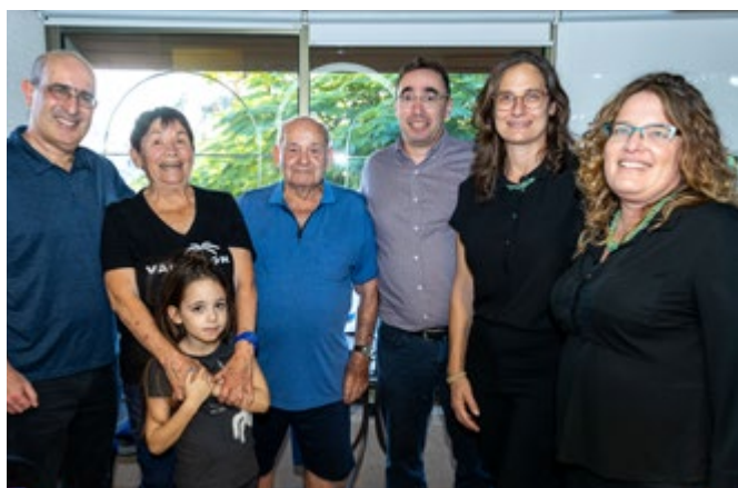
בסיור באשקלון, עם פרוץ המלחמה, יחד עם נשיא ועידת התביעות גדעון טיילור, נובמבר 2023

בעדכון מהיר מהחדשות ומהרשויות, לראות אם יש תקנות חדשות. אני צריכה לדעת אם מי מהעובדים נמצא באזור שיש בו אזעקות, האם מישהו לא יכול להגיע למשרד, מי צריך תמיכה, אילו התאמות אנחנו צריכים לעשות. בתחילת המלחמה, נאלצנו לסגור את המשרדים שלנו לכמה ימים. היו עובדים שפוננו מבתיהם, ויש לנו עובדת שבנה נפצע קשה.