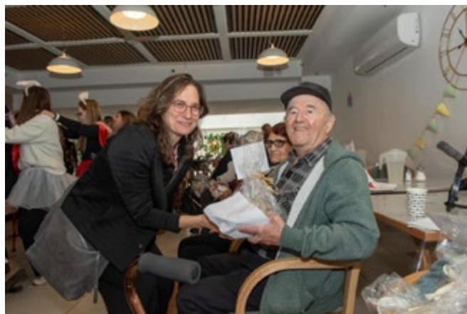
חוגגים את חג הפורים יחד עם ניצולי השואה בעיר שדרות, מרץ 2024

זו תחושת סיפוק אדירה - להיות בממשלה שאת מזוהה עם ערכיה ויש מקום לעשות עבודה משמעותית. עם השבעת הממשלה החדשה ב-2021 בראשות נפתלי בנט, הוצע לי להצטרף. זה היה רגע היסטורי - ממשלה של שמונה מפלגות שמתכנסות יחד, כולל אלה שאני מזוהה איתם. ידעתי שזו תהיה עבודה מאוד קשה, עם הרבה מתח, אבל ידעתי גם שזו זכות להיות חלק מאחת הממשלות פורצות הדרך בתולדות ישראל. כמנכ"לית משרד התפוצות, הצלחתי לשלב מיומנויות שרכשתי בעבודתי הקודמת, שכן הייתי מעורבת במאמצים אינטנסיביים לקרב קהילות בתפוצות, לחזק את הקשרים ולקדם את הזהות הפלורליסטית היהודית ברחבי העולם. ואז, שנה ותשעה חודשים לאחר מכן, כאשר הוקמה ממשלה אחרת, איש מאיתנו לא נשאר. כשחשבתי מה אני רוצה לעשות הלאה, רציתי בעצם לעשות איזושהי פעילות בנושא הנצחת זיכרון השואה, ואז הפגישו אותי עם גרג שניידר.