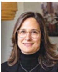
ציונה קניג-יאיר סגנית נשיא ועידת התביעות בישראל