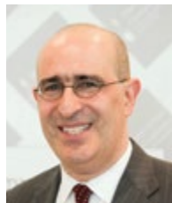
גדעון טיילור נשיא ועידת התביעות

וניצולים יקרים, לחוסן שלכם ולאור שאתם מעניקים לכולנו.